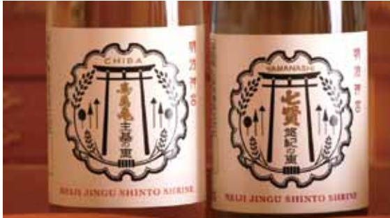
「明治神宮鎮座百年祭記念特別神酒「明治の大嘗祭」セット」 亀田酒造の寿萬亀「主基の恵」と山梨銘醸の「悠紀の恵」

鴨川市と甲府市の交流は始まったばかりだが、地元の造り酒屋の亀田酒造の寿萬亀「主基の恵」と山梨銘醸の「悠紀の恵」がセットになった特別神酒(写真)が元旦から明治神宮内で記念限定販売されている。さらに、日本の米100選に選ばれている長狭米を全国にアピールするための準備も地元の有志によって進んでいる。