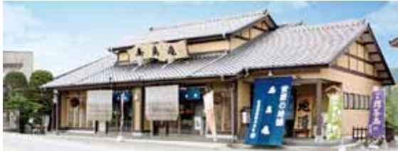
全国で唯一の明治神宮への白濁献し酒指定蔵の「亀田酒造」 窓C-2 KSH03054