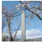
山梨県甲府市石田地区の「明治天皇悠紀齋田跡」記念碑

明治天皇即位の大嘗祭にお米を献上した鴨川市の主基齋田と、悠紀齋田のあった山梨県甲府市石田地区で収穫されたお米で作ったお酒を、2020年(令和2年)の明治神宮鎮座百年大祭に奉納する計画が進んでいる。実現すると149年ぶりに両地方からのお酒が揃うことになる。