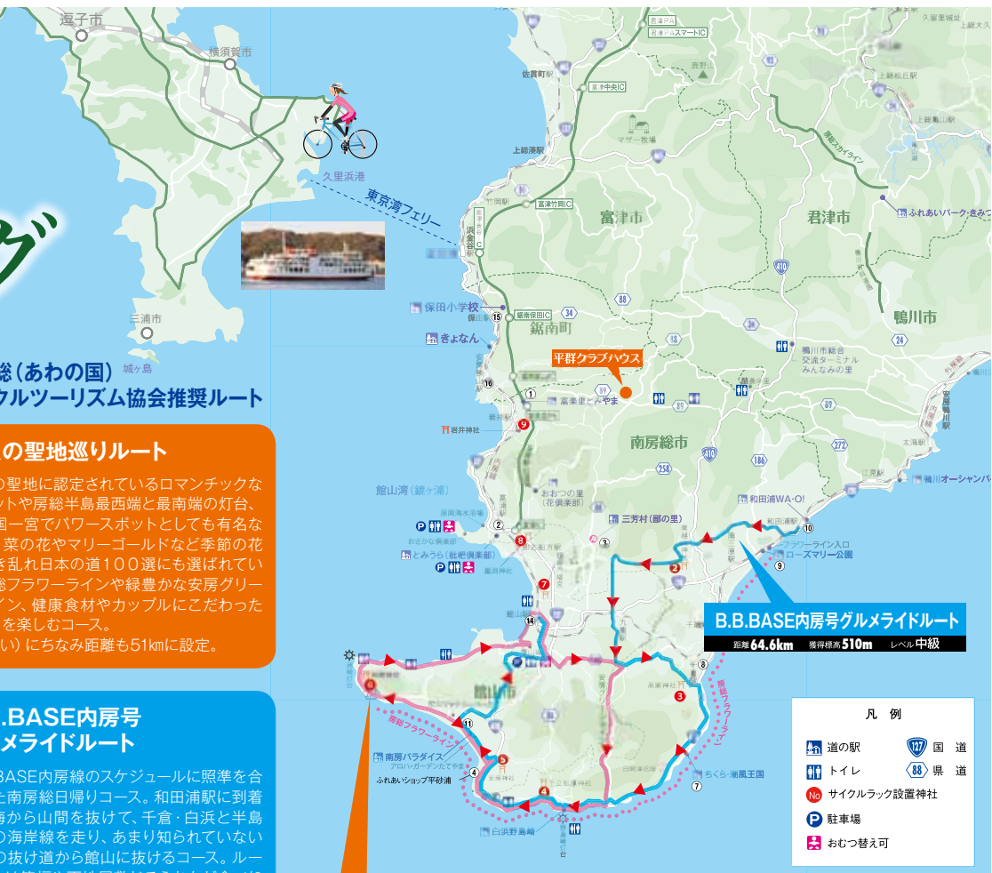
B.B.BASE内房号グルメライドルート 距離64.6km 獲得標高510m レベル 中級

●お問合せ 一般社団法人ウェルネススポーツ鴨川 ☎info@wellspo.jp ☎050-5362-4859