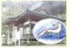
〔鴨川のむかし話〕鴨川市教育委員会発行より

太田稲荷は、誕生寺境内の左手の山にあります。ここには、今から四百年以上も前のこんな話が伝わっています。 小湊は、元禄の津波が来る前まで、今ある灯台の所よりずっと向こうまで人が住んでいたそうです。 磯にはあわびやさざえなどの資源がたくさんあったのですが、小湊と内浦では漁業権をめぐるいつつも争いが起きていたそうです。時には血を流し合うほどの大げんかになったこともあったとか。