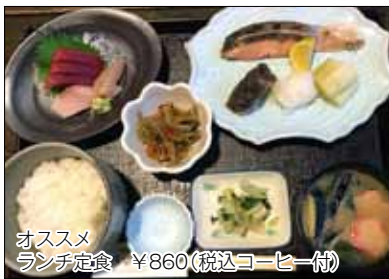
オススメ ランチ定食 ¥860(税込コーヒー付)

2019年4月に長狭街道沿いの店舗から移転。長年にわたりさまざまなジャンルの料理をされてきたマスターの味は何をいただいても間違いのないおいしさです。おすすめのランチは、メインのおかずには必ずお刺身と小鉢、食後にコーヒーが付くという贅沢な定食。週に一度のチャンスを楽しみに足を運ぶお客様も少なくない。週替わりなので毎週火曜をお楽しみに!夜はお酒を飲みながら食事するもよし。温かみがあるほっとするお料理をぜひご賞味ください!