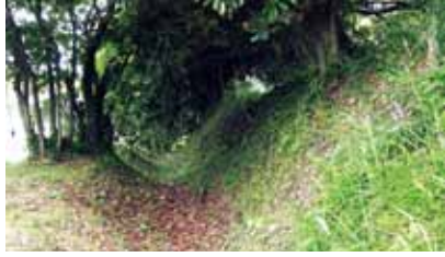
明治期に新造された一戦場公園東縁の土手

「あれ?何これ?どういうことだ?」。ファインダー越しに飛び込んできた文面が何を意味するのか、しばらく理解できなかった。そこには、貝渚区が嶺岡畜産株式会社から嶺岡牧内の土地を借りて開墾をしており、開墾地と放牧地との境に新造した土手の測量を行うことが記されていた。半信半疑で撮影を進めると、次々に関連文書が出てきた。これにより、これまで嶺岡牧の東端と言われていた一戦場公園東縁の土手は明治時代に新造されたもので、牧の東端はもっと海岸近くであったこと、大浦木戸も川口木戸も一戦場公園東縁の土手よりもずっと先であったことが分かった。嶺岡牧は、調査をする度に流布されていたものとは異なった姿が浮かび上がってくる。その度に、嶺岡牧資源が予想を上回る巨大な資源であることに驚かされる。2020年は、どんな姿が出てくるのだろうか?