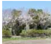
千葉県鴨川市北小町地区の「明治天皇大嘗祭御齋田主基之地」記念碑

鴨川市では40年前の明治神宮鎮座六十年大祭をきっかけに「鴨川市明治神宮崇敬講」が結成され、主基齋田址公園周辺の水田で取れた長狭米で醸造したお酒を奉納してきた。