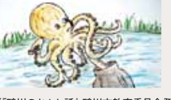
(「鴨川のむかし話」鴨川市教育委員会発行より)

鴨川のむかし話 ⑤ 魚ヶ淵(たごがふち) 待崎川の支流に伝わる「泉川滝」や「蜘蛛滝」の話は以前に紹介しましたが、もう一つ「魚ヶ淵」と呼ばれる小さな淵もあつたそうです。そこにはこんな話が伝わっています。 とても親孝行な若者が、おっ母と二人で暮らしていました。おっ母はとても体が弱く、病気がかりしていました。心配した若者が医者にみせると、「こつ言われました。「これは、きつと労咳(結核)に違いない。栄養のあるものをたくさん食べさせてあげなさい!」それからというもの、若者は百姓仕事の合間をみつけては、川に釣りに出かけ、ふなやウナギをおっ母に食べさせました。 ある日のこと。もつと釣れる場所はないかと待崎川の中を探していた若者は、まるい形をした淵を見つけました。「ここならたくさん魚が釣れそつだ」と、淵の岩のころを見てみると、大きな草魚(たご)が一匹、いるではありませんか。 さつそく小刀で足を一本切り取って、家に持って帰りました。おっ母は、おいしい、おいしいと言って喜んで食べました。 それからというもの、若者は毎日その淵に行き、草魚の足を一本切り取ってきては、おっ母に食べさせました。八日目のことです。この日も若者は足を取りに出かけたのですが、遅くも帰ってきませんでした。心配したおっ母は、近所の人にたのんで探してもらいました。村人が、川の周りを探していたところ、若者が淵の底に沈んでおり、その周りを一本足の草魚がすいすいと泳いでいるのが見つかったそうです。 村の人たちは、この草魚こそ淵の主だと思い、それからというもの、その淵にだれも近づこうとはしなかったというのです。 いつしか、その淵を「草魚ヶ淵」というようになったそうです。 ところで、「草魚」「鰯」と書かれる「タ」は、海水に住むものですが、淡水に住むタコの話、ちよつとめすらしいですね。