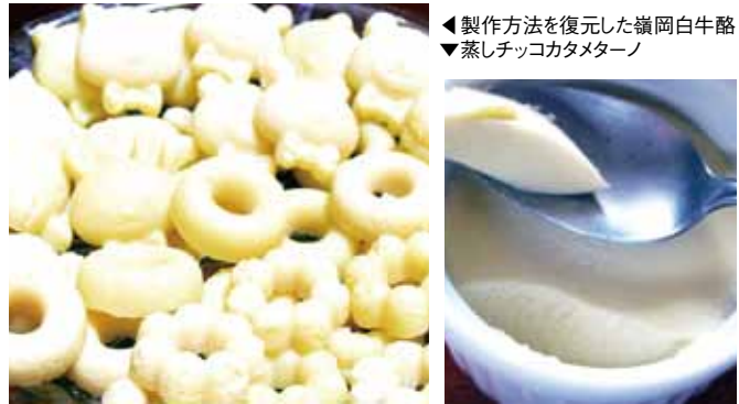
◀ 製作方法を復元した嶺岡白牛酪 ▼ 蒸しチッコカメターノ

「牛乳を蒸しただけなの?甘くて美味しい!」。「レモンの香りがパツと広がる。濃厚なのにサッパリしている」。嶺岡牧シンポジウムの時に行った「嶺岡牧の味」試食会場に驚きの声が上がった。8将軍徳川吉宗が「国民の寿命を延ばしたい!」と嶺岡牧で酪農を行い作った「嶺岡牧醍醐」を、11代将軍徳川家齊が「白牛酪」と改称した。この、嶺岡牧文化の原点である嶺岡白牛酪は、生キャラメルに近い風味だがベタつかず、濃厚にもかかわらず上品な味。そして、近代の「健康な生活を」というニーズに安房酪農で応えてきたが、それに伴って生まれた地域食文化が、売れない初乳を固めて食べたチッコカメターノ食。 今回の試食会は、プロジェクト鴨川味の方舟、及び嶺岡牧を知って活用を考える会が、歴史風土に彩られた食文化を楽しむゆとりある暮らし方を嶺岡牧から発信することを目指して実施したもの。さらに多くの方に嶺岡牧食文化を実感していただくため、秋に大きな試食会を計画している。