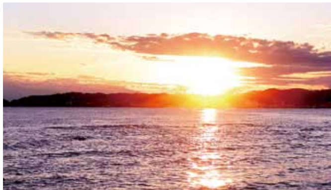
鴨川から嶺岡牧を望む

明治150年記念事業 千葉県酪農のさと ☎0470-46-8181 1/11(金)~3/31(日) ミニ企画展「嶺岡畜産株式会社の終焉(2)」 1/22(火)~毎月第4日曜日 嶺岡牧スチュワード講座 2/24(日) 現地に立って知る 日本近代酪農発祥の地「嶺岡西牧」を歩く 嶺岡牧フォーラム 日本酪農を牽引した嶺岡牧