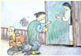
(「鴨川のおかし話」鴨川市教育委員会発行より)

天津に、駄菓子屋を売って暮らすじいさまとばあさまがいました。ある寒い晩のこと。 「ばあさまよ。今夜はさびしいなあ。はよう戸をしめて休むべえよ」 じいさまにそう言われ、ばあさまが戸をしめていると 「こんばんは、こんばんは」 と、若い女の弱弱しい声がしました。こんな時間に誰だろうと、戸をあけると、やせた色の白い女の人が立っていました。 「あじよしんだ、こんなにおせえなっ」 「すみませんが、あめを売ってください」 と、手にぎっていた一文銭を一枚さしました。なんだか変だなと思いつつもばあさまがあめを渡すと、その女は足音もたてずにすつと暗やみに消えていってしまいました。 「見たこともねえ人だな。あんだかきびがわりいねえ」 と、じいさまも首をかしげました。