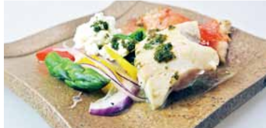
チッコカタメターノと金目鯛のボワレ