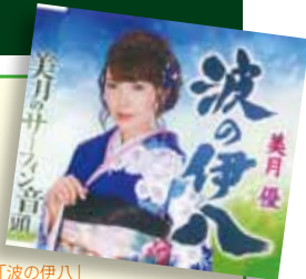
「波の伊八」 (作詞:東逸平 作曲:大船わたる 編曲:松本好文)