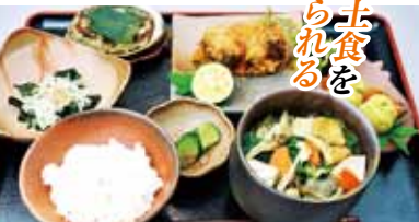
鴨川の味”料理教室でつくる鴨川秋冬膳 さんが焼き、ひじきメンチなど

千葉県が2017年12月から郷土食の収集を始めたように、今、郷土食は注目を集めている。それは、方言が地方の温もりを伝えるように、美味しい郷土食は、今の自分に至る歴史がバツと心に広がり、同郷の人と直ぐに打ち解け心が柔らかくなり至福の時をもたらしてくれることにある。鴨川では千葉県に先駆け、2009年から鴨川の郷土食を再確認し、楽しい食生活の再生を進めてきた。この鴨川方式が千葉県、そして全国に広がろうとしている。