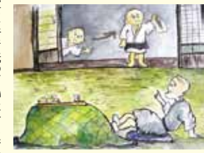
(「鴨川のむかし話」鴨川市教育委員会発行より)

東条の永明寺にとても立派な和尚様がありました。 和尚様は、たもつという小僧をたいそうかわいがっておりました。たもつは、十二歳。身なりがきちんとしていて、黒い兵児帯をしめ、腰に四つにたんだん手ぬぐいをはさんでいました。その上、近所でも評判なほどにきれいな好きで、廁から出てくると、二十分も丁寧に手を洗っていたそうです。 「これは、鼻をかんだり、廁で使ったりするものだよ。」 ある日、和尚様は、たもつに紙を渡すと、「こう教えました。 さて、寺にお客人が来ることになりました。和尚様は、たもつのきれいな好きをみんなに自慢しようと思えました。 そんなことを知らないうちに、たもつは、廁に入っていました。それを見ていた和尚様は、お客さんに、「たもつは、たもつという小僧は、とてもきれいな好きです。とくに廁から出て手を洗うのは、よく見ていただきたさい」と、これに話しました。 たもつが廁から出てくる気がしました。いよいよ手を洗うところを見せられるぞと思っていますと、なんと、たもつは手洗い場を通り過ぎて、くりの方へ行ってしまいました。 がっかりしたのは和尚様です。客が帰ったあとでたもつを呼び、「たもつは、たもつという小僧は、よく見ていただきたさい」と、これに話しました。 たもつは、たもつという小僧は、とてもきれいな好きです。とくに廁から出て手を洗うのは、よく見ていただきたさい」と、これに話しました。 たもつは、たもつという小僧は、とてもきれいな好きです。とくに廁から出て手を洗うのは、よく見ていただきたさい」と、これに話しました。 たもつは、たもつという小僧は、とてもきれいな好きです。とくに廁から出て手を洗うのは、よく見ていただきたさい」と、これに話しました。