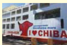
船内売店には「チーバくん」グッズコーナーが登場! 2018年1月からの時刻表には「チーバくん」をラッピングしたしらは丸のイラストを使用! (イラスト/大塚洋一 氏)