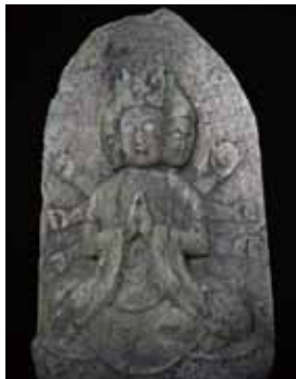
天明5(1785)年銘のある鴨川で最も古い陽像の馬頭観音

「怒っているのかな?」。鴨川の路傍に佇む馬頭観音をみていると、怒って髪を逆立てているようである。目も、口元も実に静かである。それでいて無表情で無く、柔和で暖か味を感じる。それは、叱り付けて仏法に背く者を正し災いを防ぐのでは無く、諭して導いているかのよう。 嶺岡地域は、石仏の馬頭観音が約500体と稠密に分布している。さまざまな表情をしている馬頭観音が語りかける話を、じっくりと聞いてみてはいかがだろうか。