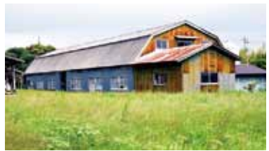
昭和14年に建てられた和光堂千歳牧場の牛舎(黒澤氏所有) 南三原駅近くの和光堂南海工場で作られていた粉ミルク