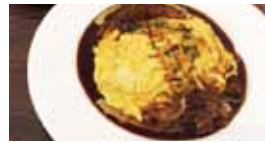
オムライス牛ほ肉とデミグラスソース (¥1,080・税込)