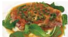
いすみ豚のソテーアンチョビとケイパーのソース (¥1,620・税込)