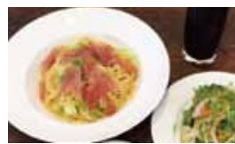
生ハムと春キャベツのペペロンチーノ (¥1,080・税込)

イオンの裏手の駐車場に隣接した白いビルの1階、真新しい入り口と清潔感があってゆったりと並べられたテーブルと椅子がリラックスできる。麻布十番のフランス料理店で8年、その後は渡米して「フレンチ&ジャパニーズ」のお店で腕を振るって帰国。ご夫妻で「伊せや」として2016年12月にオープンさせた。リーズナブルなランチのセットも充実。夜用の一品料理をオーダーしたところ、快く用意していただき、大満足! 季節の食材を豊富に使った料理を創作していきたいと意気込みたっぶり! ぜひ、ご賞味あれ。