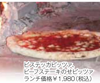
ピステツカピッツァ、ビーフステーキのセピツァ ランチ価格¥1,980(税込)

名前の由来は、イタリアで修業している時に仲の良かった、おじさん従業員のあだ名からとったもの。開店から7年半経っているが、前に出て目立とうとはせず、ひっそりとしているが、修行で学んだ伝統的な、味やこだわりの