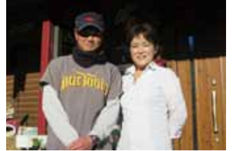
家族で事業を分担し6次産業化を推進