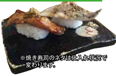
※焼き寿司のネタは生入れ状態で変わります。

地元でも人気店で近年代替りし女性板前が看板の夫婦寿司として味を守り続けてます。お勧めは「焼き寿司」生でも美味しい鴨川の地魚を使い、絶妙な焼き加減で旨みを更に引き出し、お寿司にした