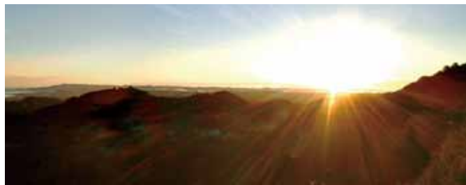
嶺岡牧から東京湾と外房の海を望む

日本で初めての地域畜産営農組織「嶺岡畜産株式会社」の業務報告に、何と明治30年代に1000頭の乳牛を飼う経営であったことを示す記録が残っていた。ここで生産された乳牛が日本の近代酪農の基盤となり、牛乳を加工する製乳業の展開をもたらした。嶺岡牧は、1)日本近代酪農発祥の地、2)地域畜産会社の誕生地、3)主要製乳業の誕生地と、複合的牛乳食文化のルーツ。明治政府は、列強に勝つ強い兵隊確保のため肉食、牛乳食を核に日本食生活の近代化を進めた。その中心であった嶺岡牧は国指定史跡が妥当な歴史文化遺産。そこに着目した企画が、千葉県酪農のさと、NPO法人大山千枚田保存会、日本酪農乳業史研究会で、2016年に相次いで行われる。