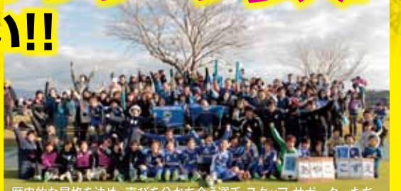
歴史的な昇格を決め、喜びを分かち合う選手・スタッフ・サポーターたち (2015年12月13日(日) 熊本県菊池市七城運動公園サッカー場)

南房総初の全国リーグ参入チーム誕生という歴史的偉業を成し遂げたオルカですが、今シーズンはなでしこリーグ2部昇格という、さらなる高みを目指した戦いとなります。全国の強豪チームとの戦いが繰り広げられる一年。南房総初女子サッカーチーム オルカ鴨川FCの快進撃に目が離せません。おらがチームを地域みんなで力強くバックアップしていきましょう!