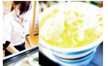
店長お手製のモモコアイス

房総の豊かな環境のなかに、乳牛が自由に歩き回れるフリーストール牛舎がある。楸須藤牧場(館山市)では、自給生産のトウモロコシとソルガム、地域内供給の豆腐粕と稲わらなどの良質飼料によりホルスタインとジャージーを飼養している。新鮮ミルクと大松農場(旭市)のこだわり卵による原料をマイナス30℃のプレート状のコールドパンに流し込み手際よくかき混ぜるとしだいに固まり、特製「モモコアイス」が完成する。熱を加えず素材の持ち味を引き出し、口に入ると濃厚でありながらさらりと溶ける。アイスクリームの概念が変わる瞬間である。食の大切さに気付いてもらうには本物のおいしさを伝えるしかないとの経営理念は、酪農教育ファームで年間最高90団体2,000人受入の実績にも表れている。