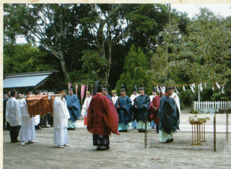
天津神明宮 ●鴨川市天津2950 TEL 04-7094-0323

毎年十月十六日、天津地区に鎮座する天津神明宮の例祭が行われます。 天津神明宮は「房州伊勢の宮」と呼ばれ、八百二十余年前に源頼朝が伊勢神宮から神霊を勧請して建てられた神社で、伊勢神宮と同じ天照大御神、豊受大神、また神代のむかしから当地にまつられていたと伝えられる八重事代主神(えびす様)が主神としてまつられています。 例祭は翌十七日の伊勢神宮での神嘗祭にならって行われています。午前には神事、午後には各町内より万燈が集まって演芸大会などが行われ、境内は大勢の参拝者でにぎわいます。 前日十五日の夜には宵宮祭が厳かな雰囲気の中行われます。町内の氏子が集まり、お祓いの後、口ウソクの灯を神前に捧げます。献燈祭とも呼ばれ、どなたでも参列できます。