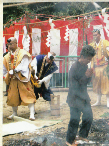
浪切不動尊 ●鴨川市天津72 TEL 04-7094-0800