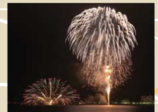
鴨川市観光納涼花火大会 (前原海岸 7月30日 19:30~)

内浦海水浴場 ●駐車場有(有料) 海の家有 JR安房小湊駅より徒歩1分。 波穏やかな海水浴場は、脇に磯の 風景が広がり、海水浴と磯遊 びが楽しめる。